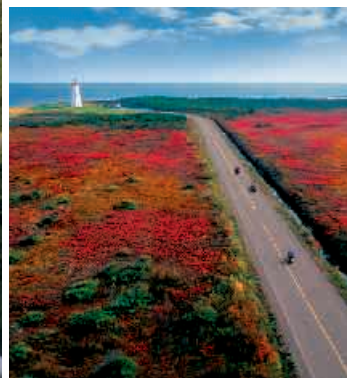
▲ New Brunswick