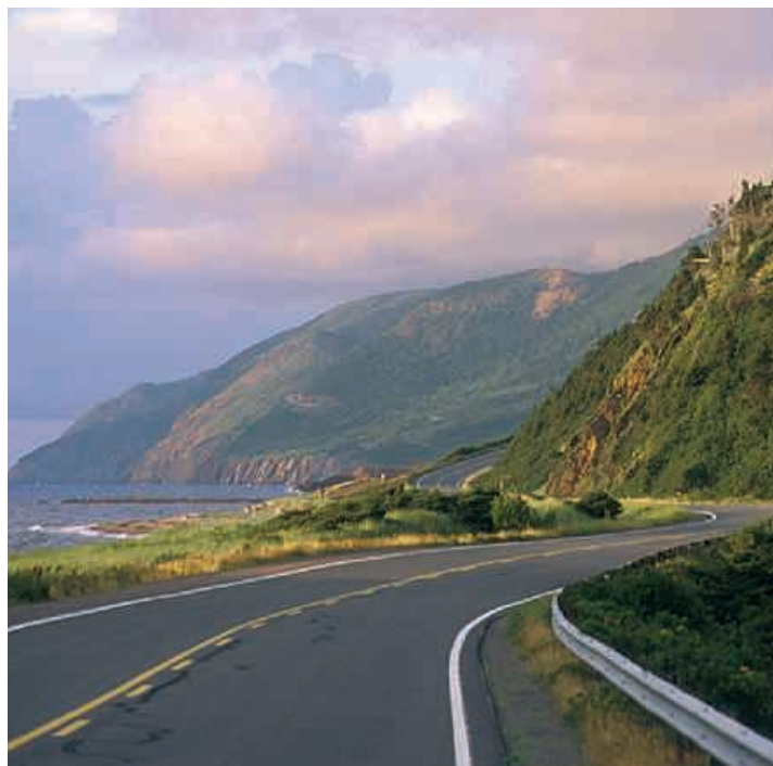
▲ Nova Scotia