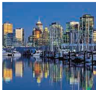
▲ Vancouver, British Columbia