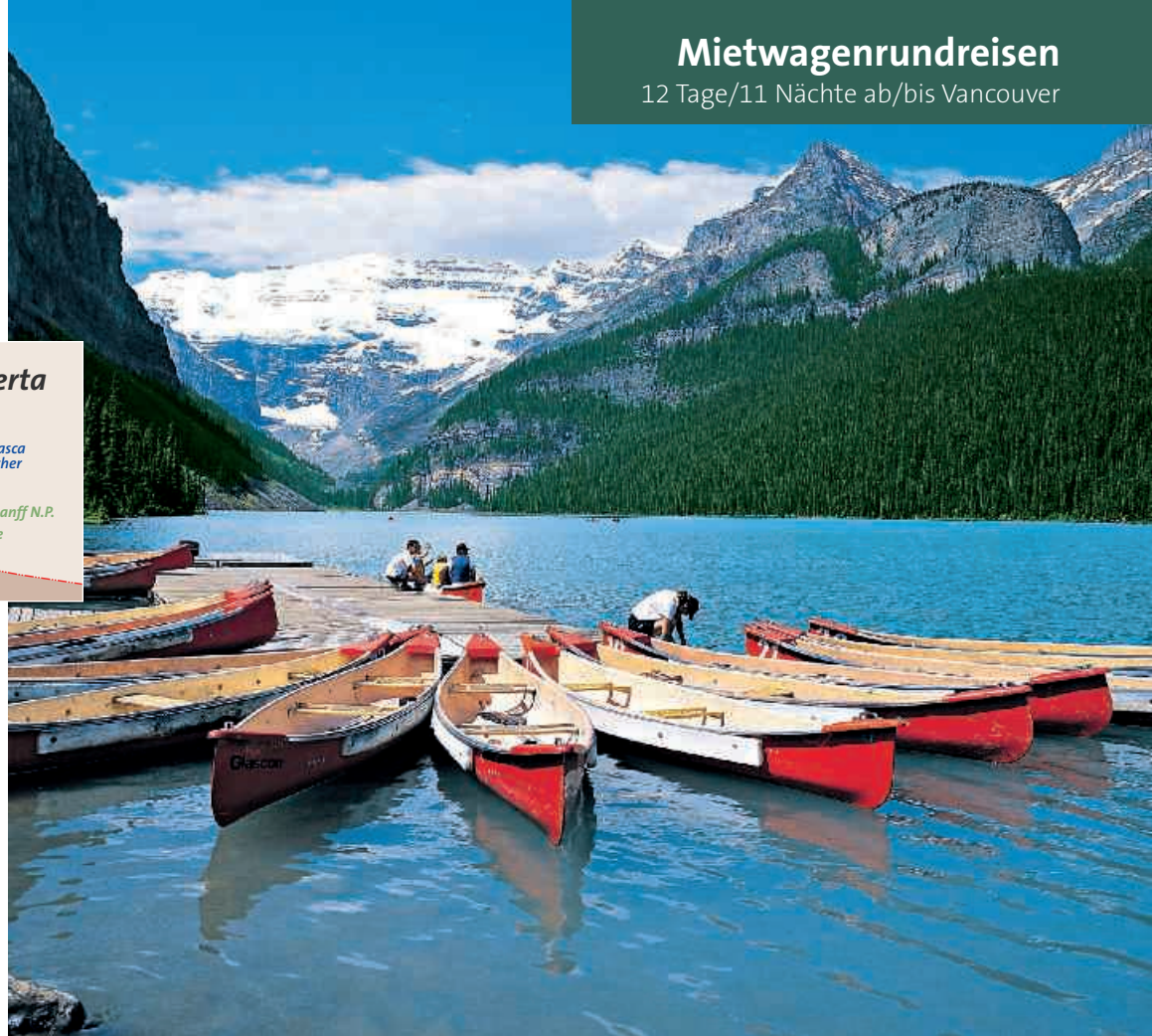
▲ Lake Louise

Über den Yellowhead Parkway fahren Sie zurück nach British Columbia. Vorbei am Wells Gray Provincial Park geht es weiter nach Sun Peaks. ca. 443 km