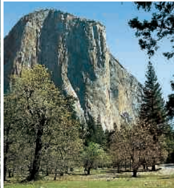
▲ El Capitan, Bridalveil Falls, Yosemite Nationalpark