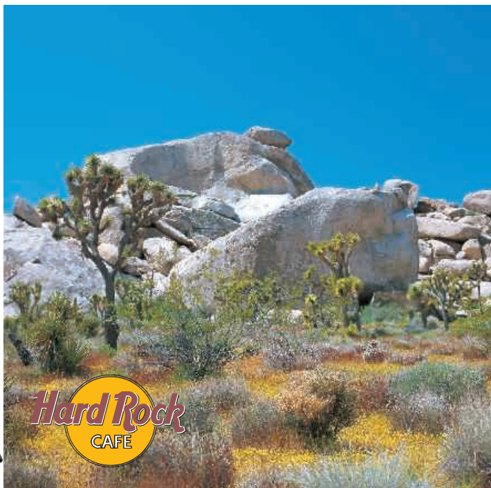
▲ Joshua Tree Nationalpark