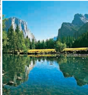
▲ Yosemite Nationalpark, El Capitan