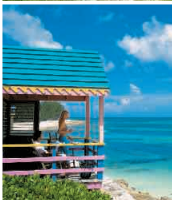
▲ Compass Point, Bahamas

1. Tag: Ankunft in Orlando Willkommen in der „Magical City“ Orlando! Der Shuttlebus von Alamo bringt Sie zur Anmietstation. Übernahme des Mietwagens und Fahrt zu Ihrem Hotel.