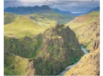
▲ Oregon Coast

diese historische Region mit zahlreichen Sehenswürdigkeiten zu erkunden. 15. Tag: McMinnville - Portland Heute ist es nur eine kurze Fahrt bis Portland. Erkunden Sie die größte Stadt Oregons mit ihren zahlreichen Sehenswürdigkeiten wie z.B. die Old Town, Chinatown, den berühmten Rosengarten, Powell's City of Books oder die zahlreichen Mikrobrauereien. Außerdem ist Portland ein Highlight für Shopping-Fans, denn Oregon ist steuerfrei! Tipp: Das Woodburn Company Stores Outlet, ca. 1 Std. südlich von Portland. Genießen Sie heute außerdem Ihre inkludierte Wohlfühlmassage. ca. 60 km